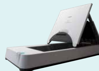
Jednotka plochého skeneru 101 formátu A4

Skenujte knihy, časopisy nebo křehká média s pomocí jednotky plochého skeneru 101 pro dokumenty do formátu A4 nebo jednotky plochého skeneru 201 pro dokumenty do formátu A3. Tyto volitelné ploché skenery se ke skeneru DR-C225 (pouze k tomuto modelu) připojují přes rozhraní USB a perfektně s ním spolupracují. Můžete tak skenovat dvojnásobný počet dokumentů a využít přitom stejné funkce vylepšení obrazu při každém skenování.