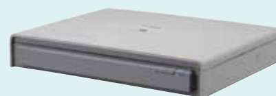
Jednotka plochého skeneru 201 formátu A3