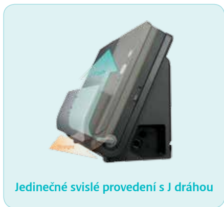
Jedinečné svislé provedení s J dráhou

Díky svislému provedení s J dráhou dokumentů lze dokumenty podávat a vyzvedávat svisle, takže nebudete potřebovat žádné místo navíc. Kabely jsou k portům přivedeny z boku, proto můžete oba skenery umístit zadní stranou těsně ke zdi nebo dokonce na polici. Ušetříte tím místo a zvýšíte uživatelský komfort.